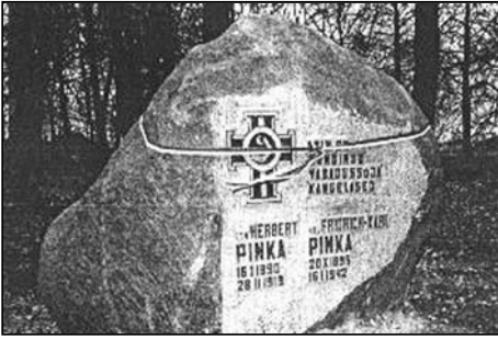
Mälestuskivi vendadele Pinkadele Viljandimaal Kärstna mõisa Murikatsi kariamõisa iuures.