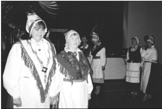
Esineb Koonga tantsurühm