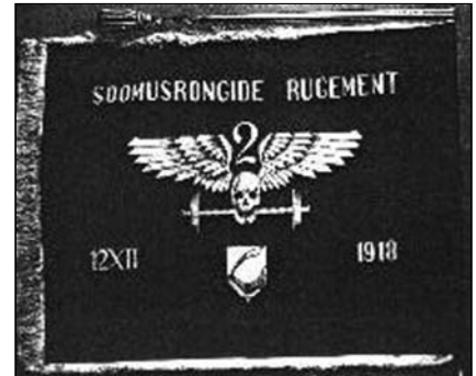
2.soomusrügemendi lipp. Kuupäev näitab rügemendi koosseisu arvatud Laidarööpmelise soomusrongi nr.2 asutamisaega.

asus oma nahka päästma. No ja kuidas sa niisuguse mehe üle kohut mõistad, keda mehed on valmis kätel kandma.