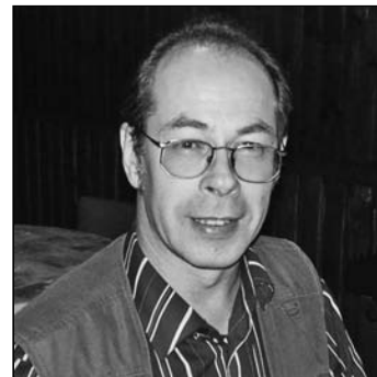
Silver Seegar 76 häält